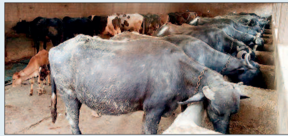
गर्मी में दूध उत्पादन प्रभावित पशु चिकित्सकों के अनुसार अत्यधिक तापमान के कारण मवेशियों में तनाव बढ़ जाता है और लोहारियों का खतरा भी अधिक रहता है, जिससे दूध उत्पादन प्रभावित होता है। उन्होंने पशुपालकों को सलाह दी है कि वे मवेशियों को ठंडा वातावरण, पर्याप्त पानी और संतुलित आहार उपलब्ध कराएं, ताकि उत्पादन में गिरावट को कम किया जा सके।